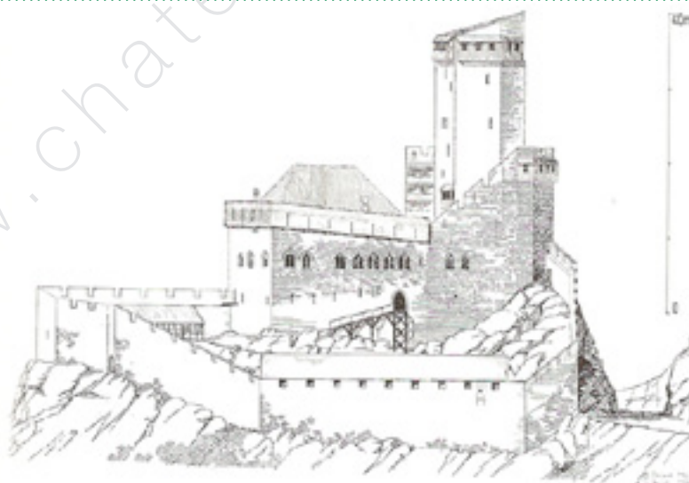
Reconstitution de Ortenberg par Th. Biller d'après B. Ehardt.