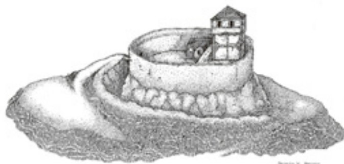
Aspect supposé du Petit-Ringelstein par N. Mengus