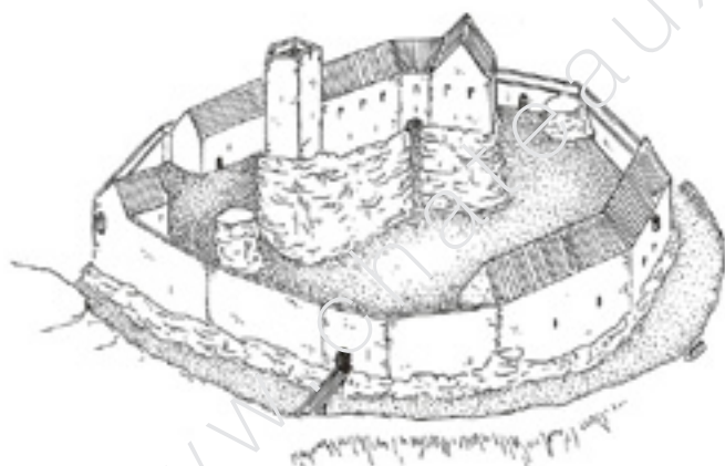
Vue idéale du Grand-Ringelstein. Dessin N. Mengus

Sur ce même massif du Ringelsberg sont visibles, outre les châteaux déjà mentionnés, les deux enceintes de la Schwedenschanz et du Spiess (auxquelles s'ajoute celle du Kastel sur la rive droite de la Hasel). Elles sont toutes les trois contemporaines du siège du Hohenstein de 1338.