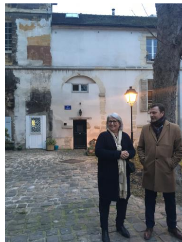
Les rapporteurs en déplacement au Couvent des Ursulines (Saint Denis)

► Enfin, la pérennisation de cette opération nécessite d'en prévoir l'évaluation régulière par le Parlement , sur la base d'un bilan chiffré remis chaque année par le Gouvernement.