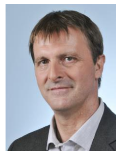
Rapporteur Michel Larive Député de l'Ariège (La France Insoumise)