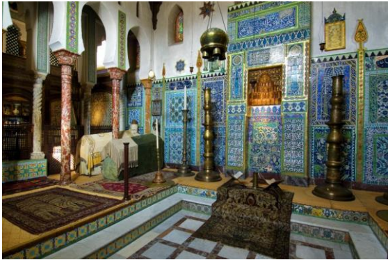
Maison de Pierre Loti (Rochefort)

► Les rapporteurs estiment que cette initiative est structurante pour l'avenir et qu'elle doit être pérennisée, à condition toutefois que ses modalités soient amendées.